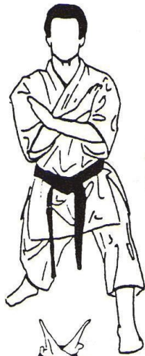
13 - Sur place Temps intermédiaire Préparation du blocage