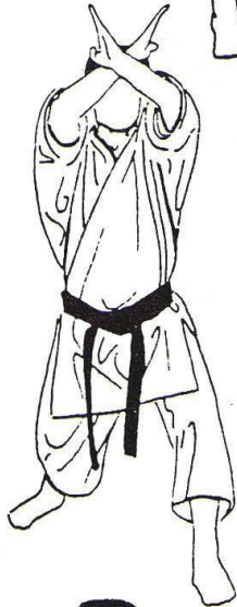
14 - Sur place Jodan Juji Uke mains ouvertes