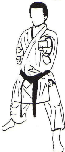
16 - Sur place Chudan Zuki