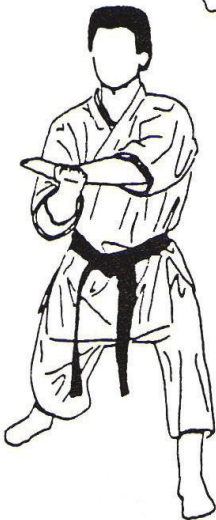
15 - Sur place Chudan Osae Uke