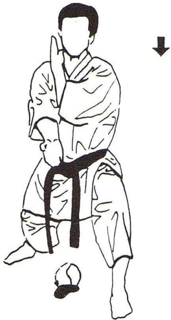
31 - Zen Kutsu Dachi gauche Jodan Nagashi Uke gauche Gedan Shuto Uchi droit