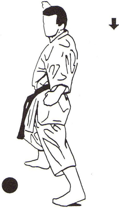
30 - Mouvement intermédiaire Préparation des techniques